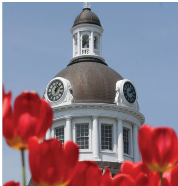
Hôtel de ville de Kingston